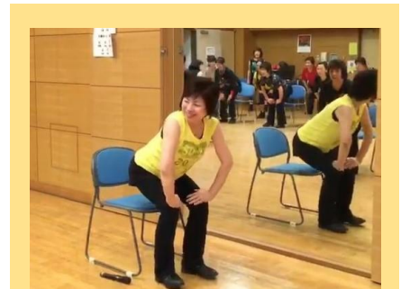
▲理事長によるMYフィットネス講習会 MM教室『もっとMYフィットネス』の略 正しい体の使い方を身につけましょう！

★休憩 ★ 10分 ★★★★★★★★★★★★★★★★★★★★★★★★★★★★★★★★★★★★★★★